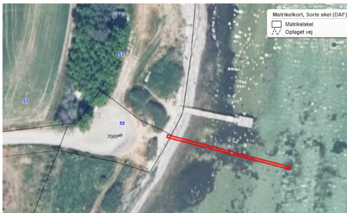
Figur 1. Luftfoto af den eksisterende bro fra sommer 2023, som ses nord for den ansøgte bro (rød polygon).

Den eksisterende bro er beliggende på Fejð ved Sletteren Strand tæt på Sletteren sommerhusområde ud for ejendommene Slettervej 55 og 53, 4944 Fejð med landfæste på matr.nr. 49d Østerby By, Fejð.